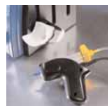
Kézitartó érintésérzékelő kapcsoló és beépített lámpa.