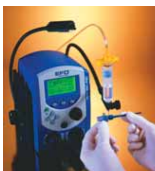
2400-as adagoló munkaállomás lámpával és rugalmas fecskendőtartóval.