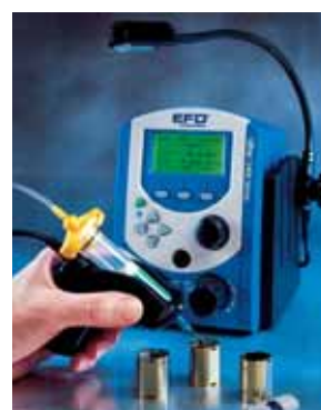
2400-as állomás polccal és érintésérzékelő kapcsolóval.