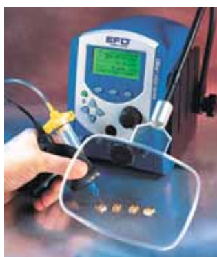
Ultra 2400-as nagyítólencsével és érintésérzékelő kapcsolóval.

Garantáltan megakadályozza, hogy a visszaszívott folyadék az adagolóba jusson. 30 cm 3 folyadék tárolására alkalmas.