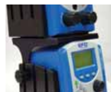
Munkaterület növelő polc.